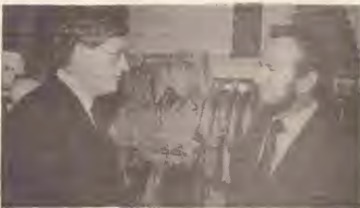
Vice-Premier H. Wiegel y Consehero General Betico Croes ta intercambia Ideanan durante bishita di e mandatario Hulandes na Aruba.